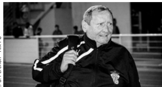
© S. Perennon - Aix FC