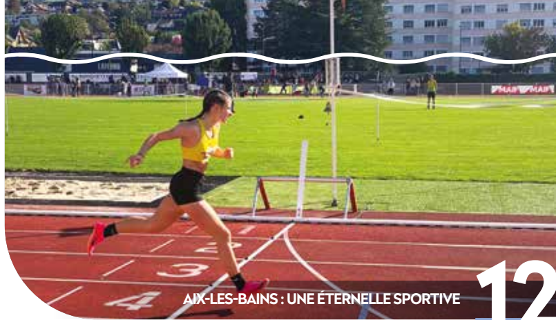
AIX-LES-BAINS : UNE ÉTERNELLE SPORTIVE