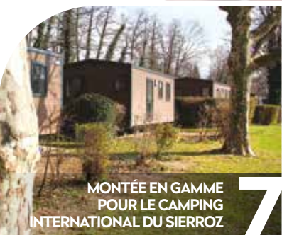
MONTÉE EN GAMME POUR LE CAMPING INTERNATIONAL DU SIERROZ