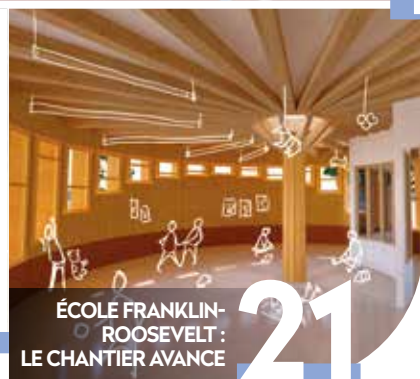
ÉCOLE FRANKLIN-ROOSEVELT : LE CHANTIER AVANCE