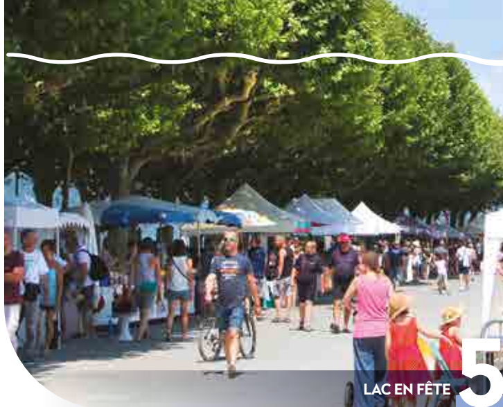
LAC EN FÊTE