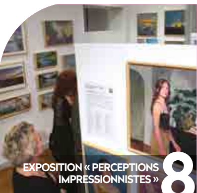
EXPOSITION « PERCEPTIONS IMPRESSIONNISTES »